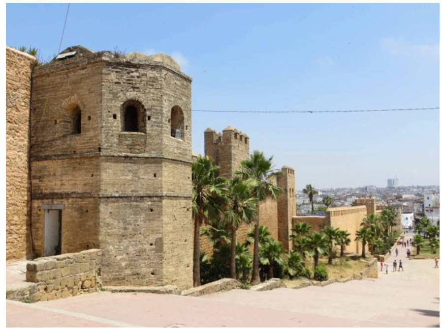
Le Casbah, Rabat, haut lieu touristique.

Ce monsieur proposait du thé au visiteurs du Casbah.