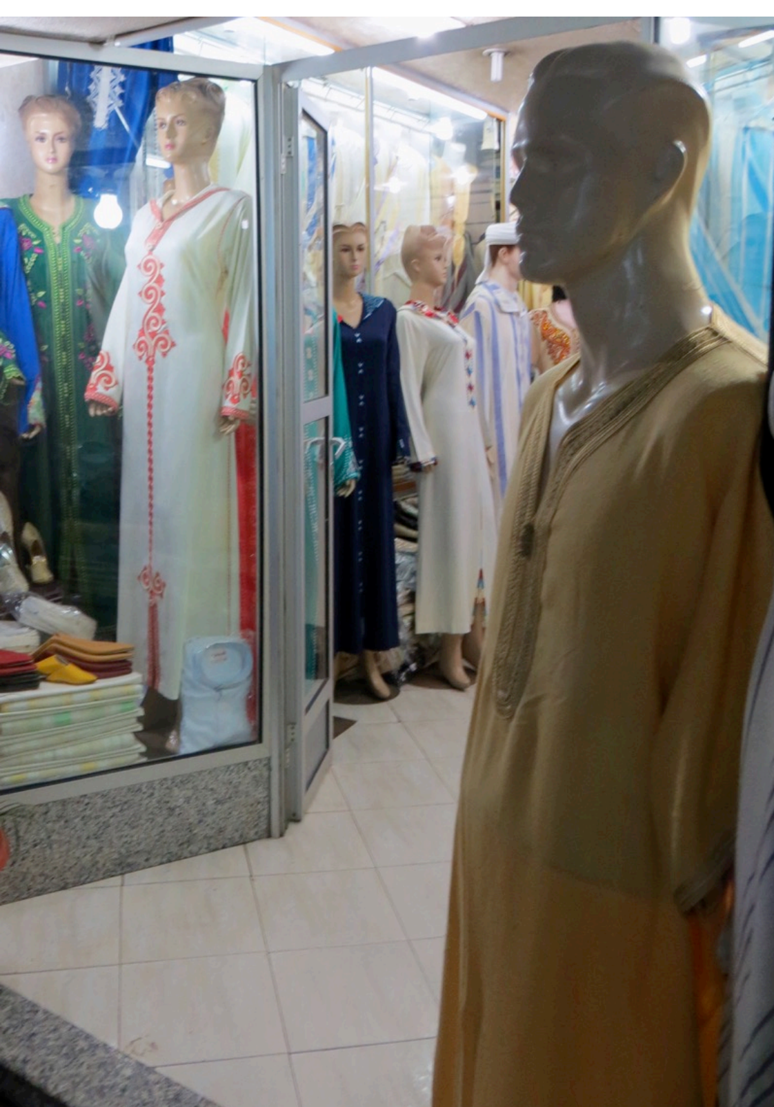
Magasin dans le quartier des affaires, Casablanca