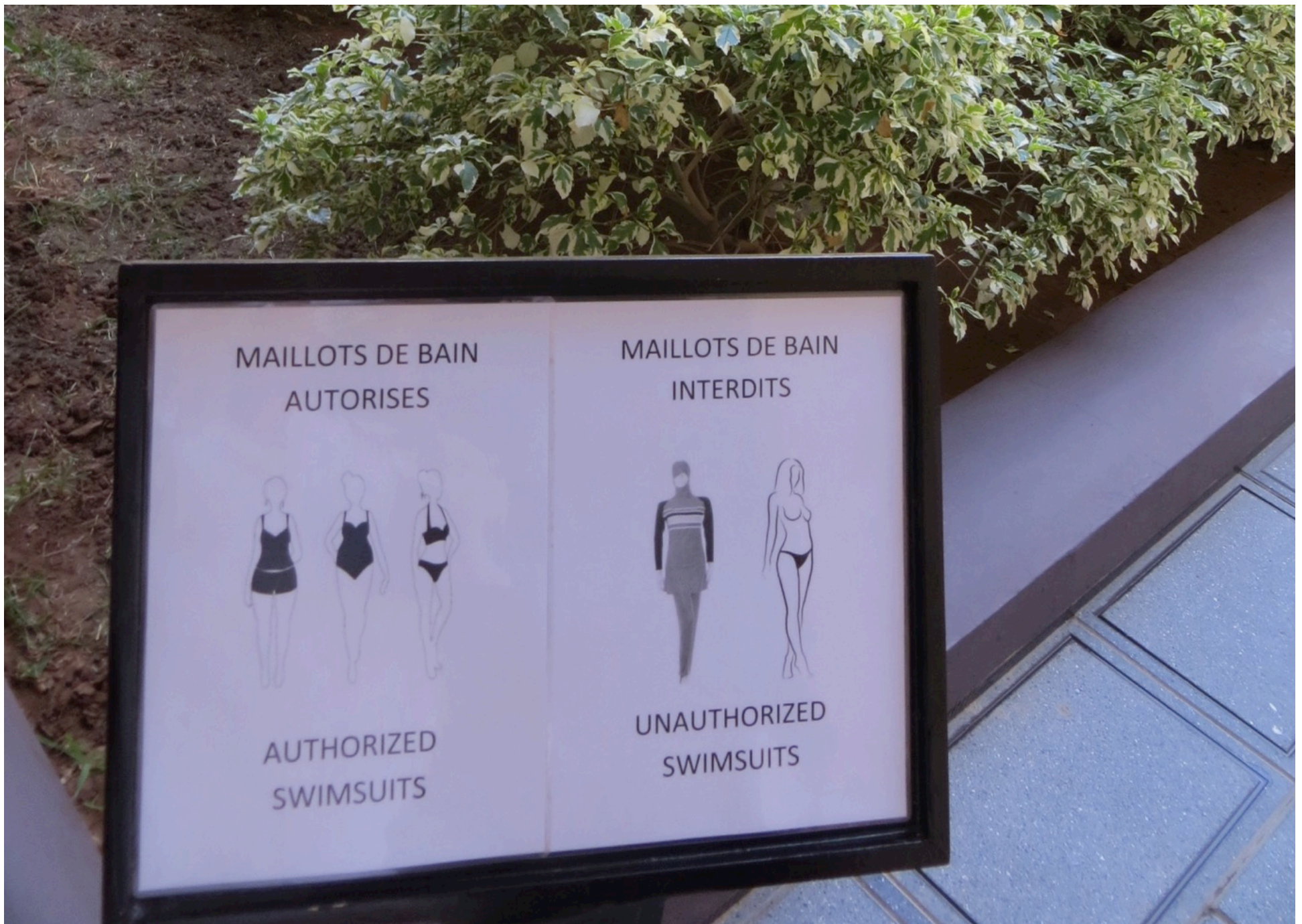
À côté de la piscine d'un hôtel pour touristes à Marrakech