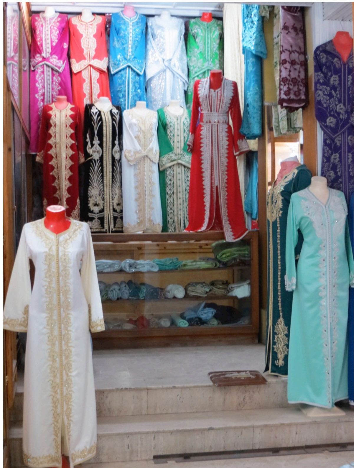
Tanger, au Petit Souk