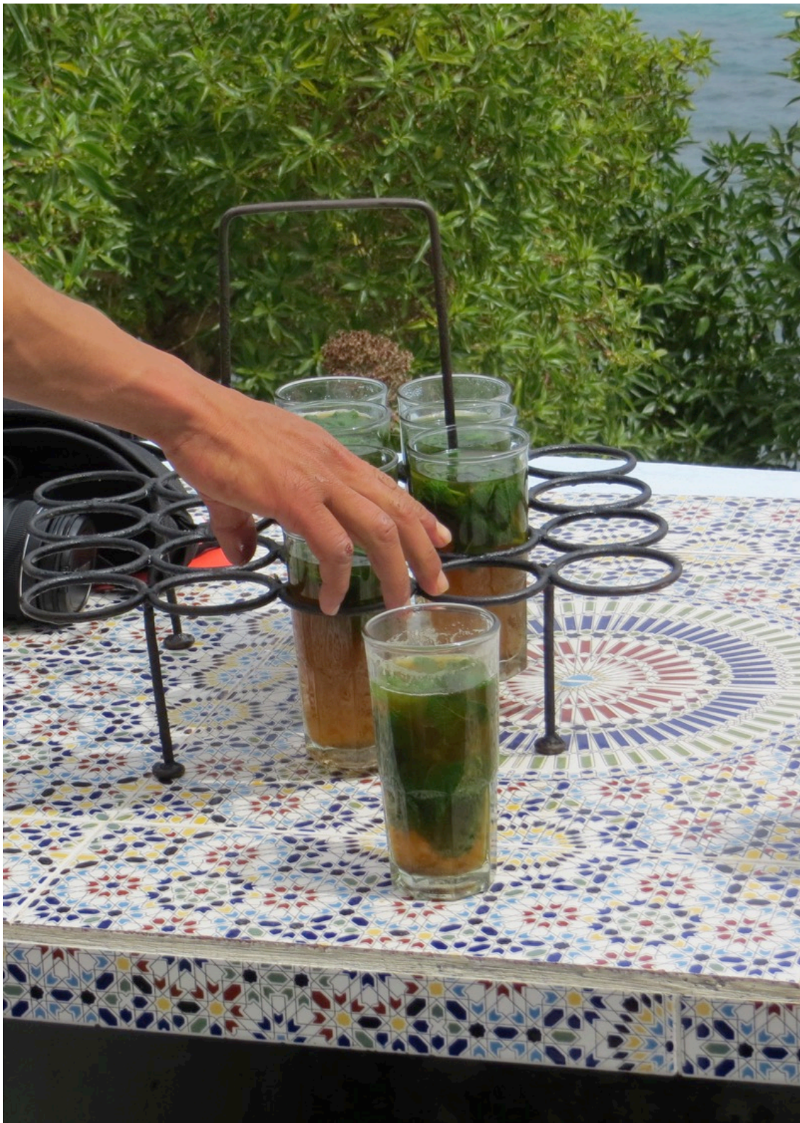
Tanger, Café HAFA,