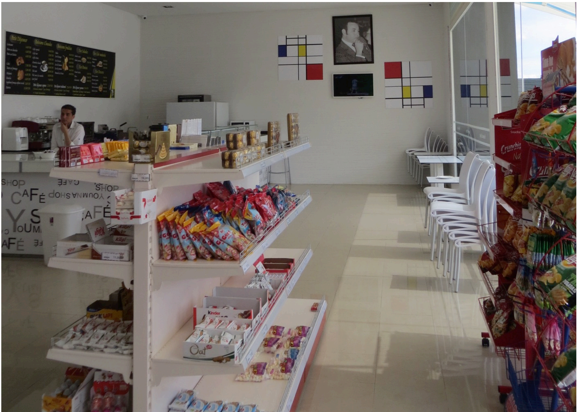
Dans une station service entre Fès et Marrakech (15 juin, 2015)