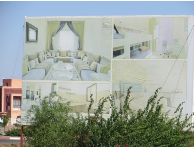
Publicité immobilière près de Marrakech

Le style du salon marocain, lieu d'accueil par excellence, peut varier selon les goûts des les moyens des gens, mais certaines choses se trouvent presque partout. Les canapés (sofas, divans, banquettes) et tapis sont souvent disposés de la même manière et les objets de décor sont aussi reliés à l'hospitalité. Les objets qui servent à recevoir prédominent : le service à thé en argent ciselé (théières, sucriers), encensoirs, récipient à fleur d'oranger, photophores, plateaux et couvercles.