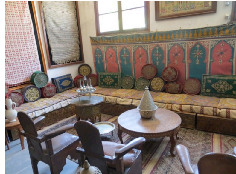
Appartement, Musée Belghazi, Rabat, 2015

Voir aussi http://salons-marocain.blogspot.com/