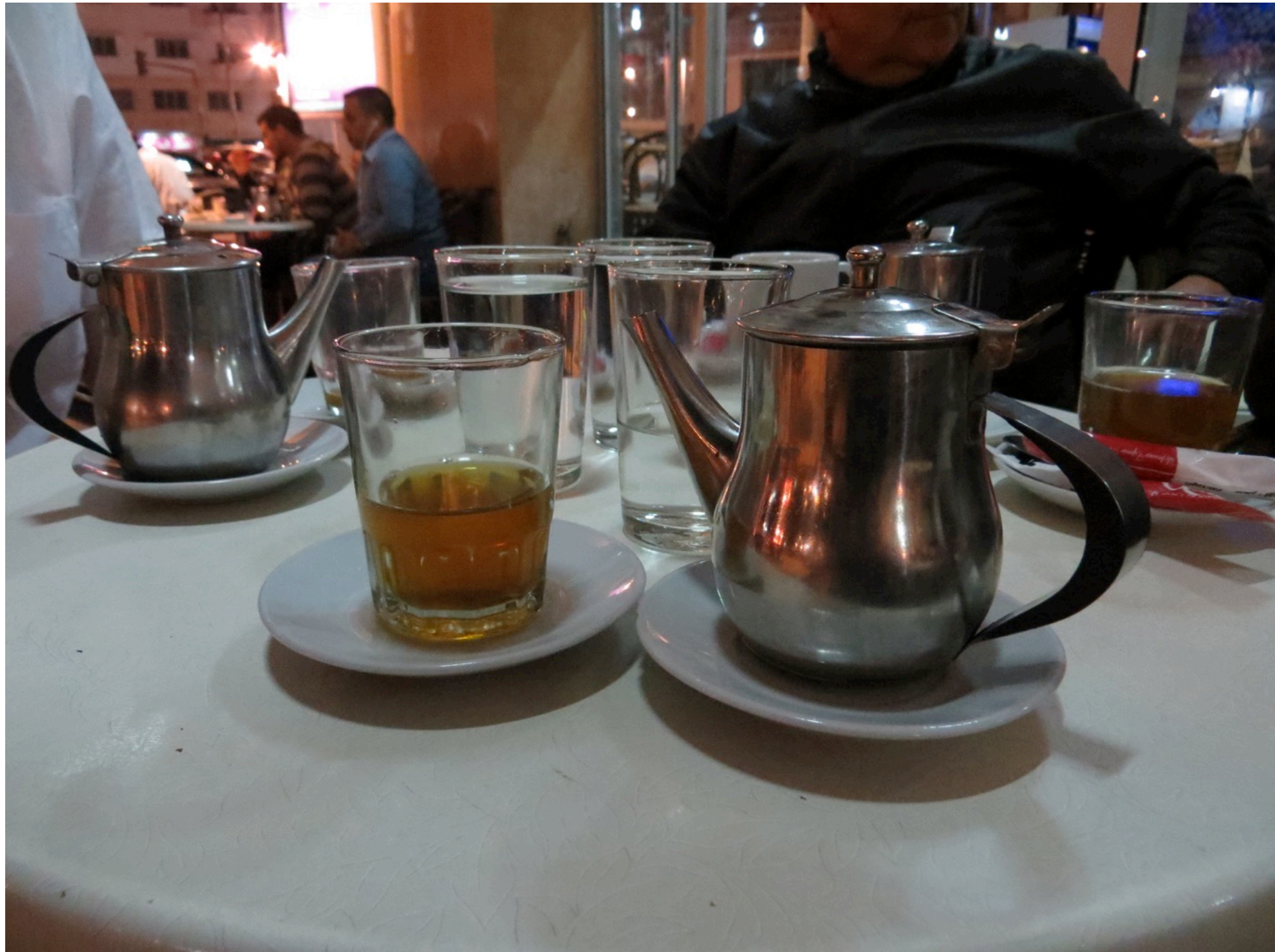
Café / Restaurant, Rabat