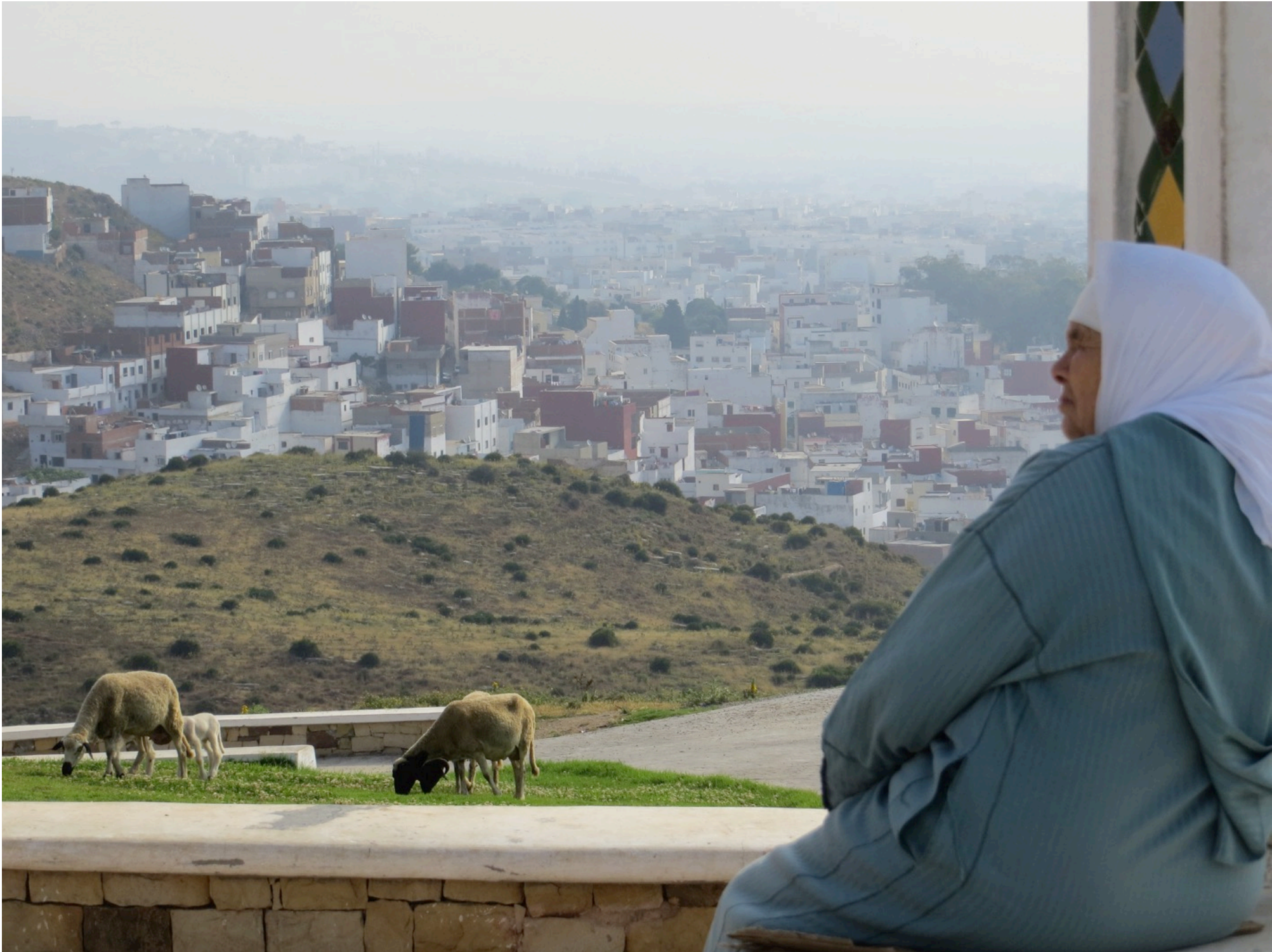
A Tétouan, 2015